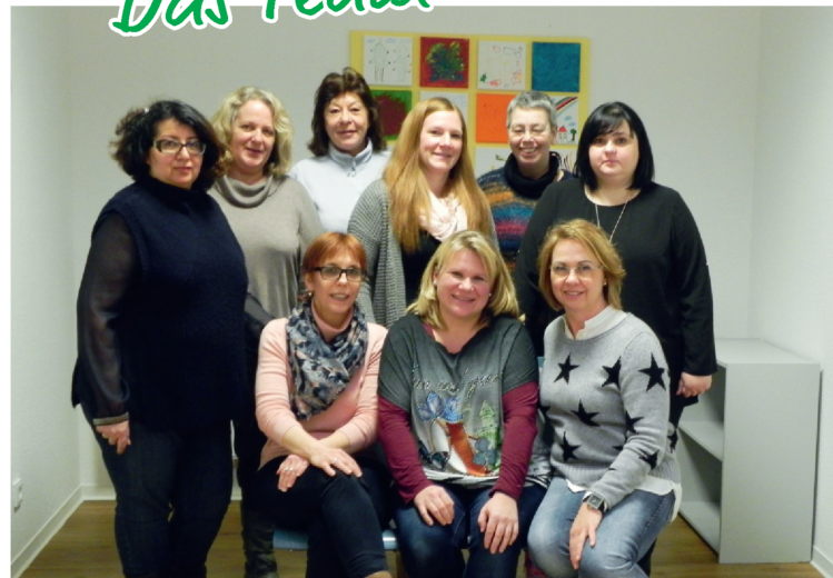
Die Fachkräfte Frühe Hilfen mit der Koordinatorin der Stadt Salzburg.

Die Fachkräfte Frühe Hilfen begleiten Sie auf Ihren Wunsch in der Schwangerschaft, nach der Geburt Ihres Kindes und/oder beim Vorliegen von chronischen Erkrankungen oder Beeinträchtigungen.