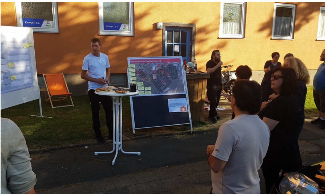
Impressionen Nachbarschaftsgespräche Kamp.I 36