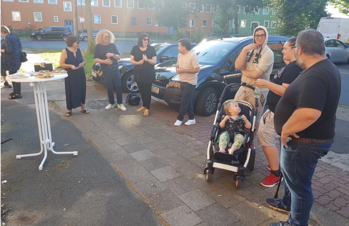
Impressionen Nachbarschaftsgespräche Kamp.I 36