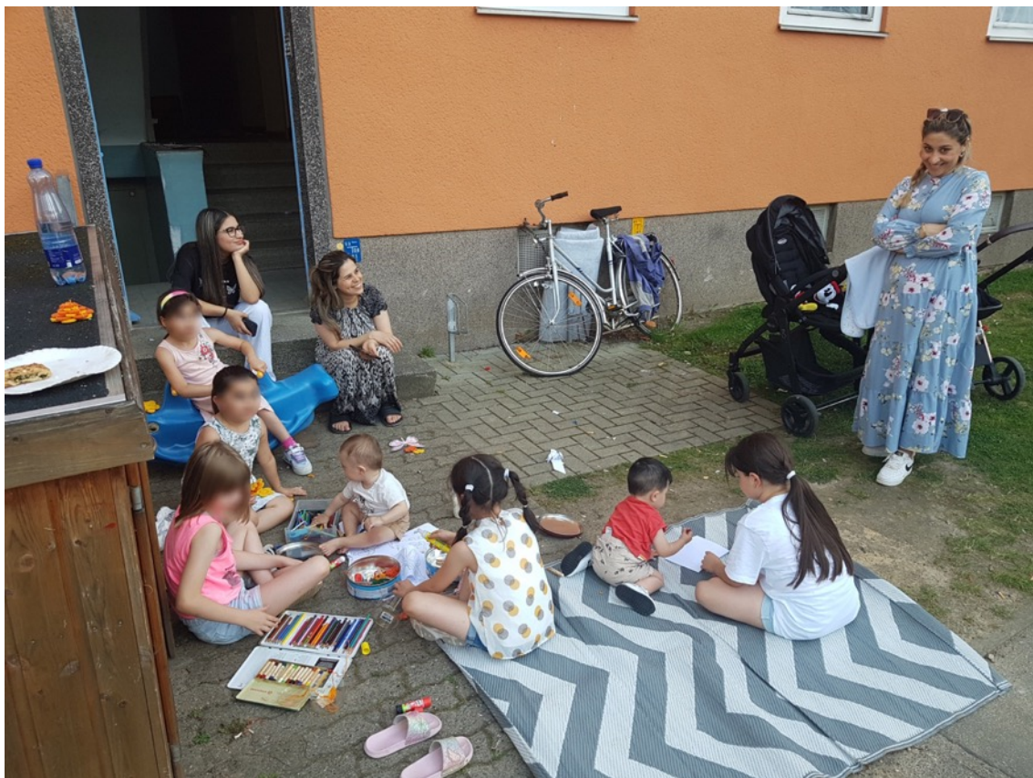
Impressionen Nachbarschaftsgespräche Kamp.I 36