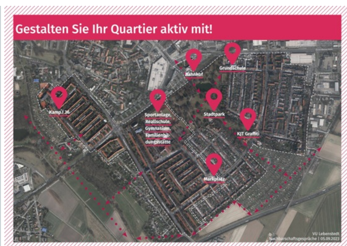
Plakate (Blanko, ohne Ergebnisse): Priorisierung wichtigste Veränderungswünsche (Plakat Veränderungswünsche) sowie Luftbildkarte mit möglichen Maßnahmenbereichen (Plakat Luftbild)