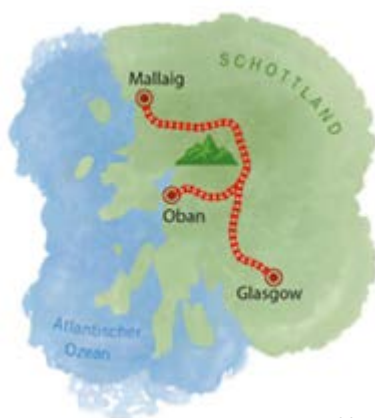
West Highlandline

Die Kulisse dieser Bahnstrecke kennen nicht nur Globetrotter. Denn der Weg führt über das Glenfinnan-Viadukt, das viele aus dem Film „Harry Potter“ kennen dürften. Wer will, bekommt im „Hogwarts Express“ Cheddar-Sandwiches und Scones serviert. Schönes Extra: rechter Hand der wolkenumgebene Ben Nevis, Großbritanniens höchster Berg.