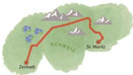
Schweizer Glacier Express

Fast acht Stunden braucht die Schmalspurbahn für ihre relativ kurze Strecke von knapp 300 Kilometern. Perfekt, um bei einem vornehmen Gänge-Menü den Blick in aller Ruhe über schneebedeckte Alpengipfel und lila gesprenkelte Blumenwiesen schweifen zu lassen. Schönes Extra: durchs Panoramafenster in die Rheinschlucht sehen.