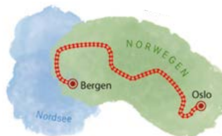
Bergenbahn Norwegen

Mit der Bergenbahn kann man auch nachts fahren. Dann jedoch verpasst man das Grün und vor allem das viele Blau, das die Zugstrecke umgibt. Seen, Flüsse, Fjorde und Wasserfälle lässt die höchstgelegene Bahn Nordeuropas auf ihrem Weg hinter sich. Kein Wunder, dass man die Gegend um die Station Finse auch als Mini-Antarktis bezeichnet: Mit etwas Glück entdeckt man hier im Vorbeifahren auch mal einen weißen Polarfuchs oder eine Rentierherde. Schönes Extra: der Kontrast zwischen schneebedeckten Felslandschaften und gelegentlichem Sonnenschein